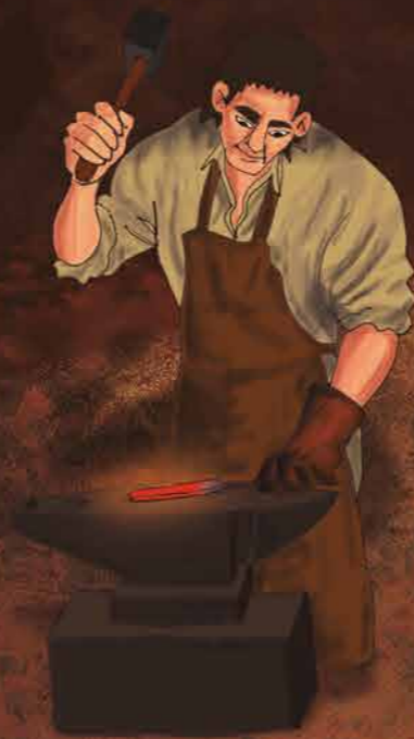
LAN TRESNAK HOBETU